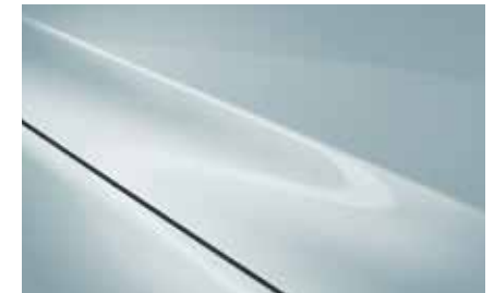
Air Stream Blue (52L)