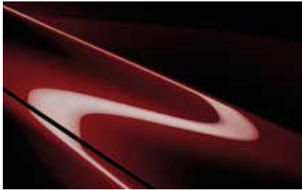
Artisan Red (51F)***