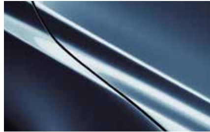
Eternal Blue (45B)