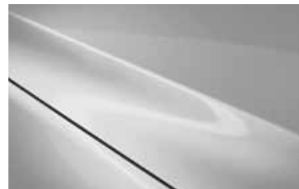
Aero Grey (52C)