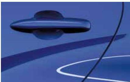
Glass Blue (50G)**