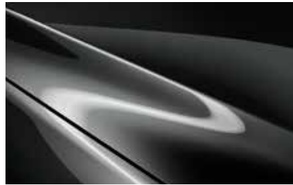
Machine Grey (46G)