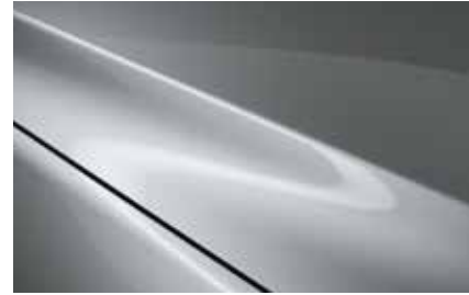
Sonic Silver (45P)