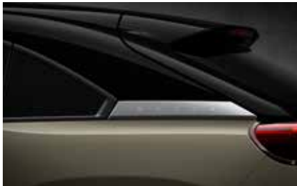
Zircon Sand (Multitone) (49T)*