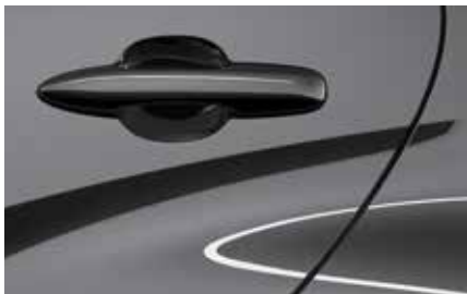
Lead Grey (48G)**