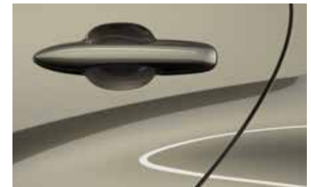
Monument Bronze (48H)**