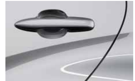
Stormy Silver (49S)**