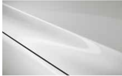
Snowflake White (25D)