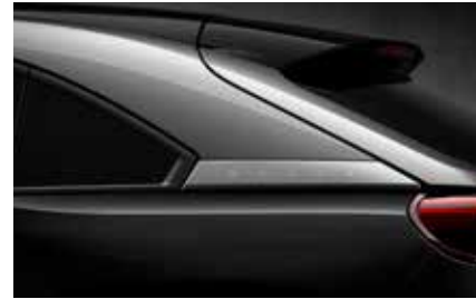
Jet Black-Silver (Multitone) (49P)*