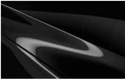
Jet Black (41W)