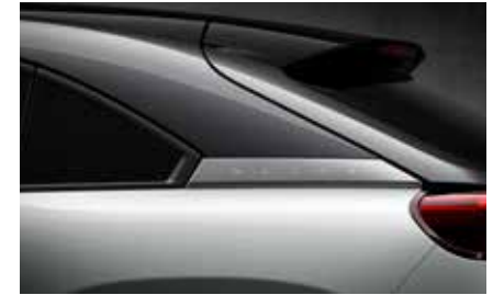
Ceramic White (Multitone) (48A)*