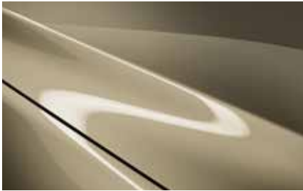
Zircon Sand (48T)