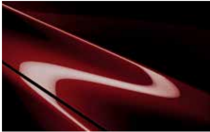
Artisan Red (51F)***