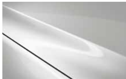
Rhodium White (51K)