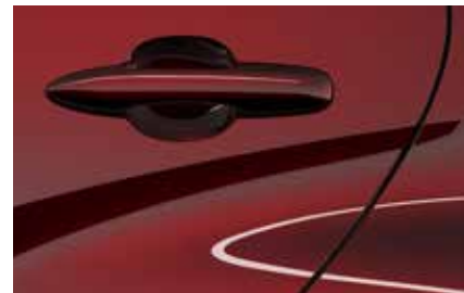
Formal Red (A9V)**