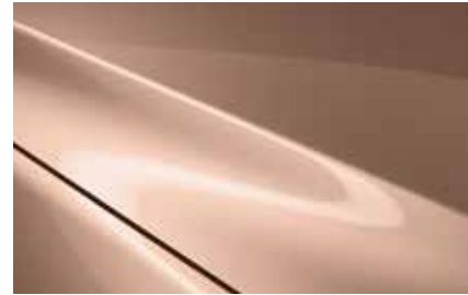
Melting Copper (52H)****