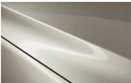
Platinum Quartz (47S)