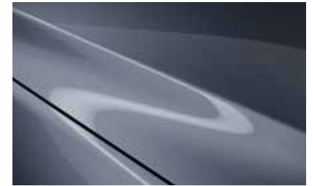
Polymetal Grey (47C)