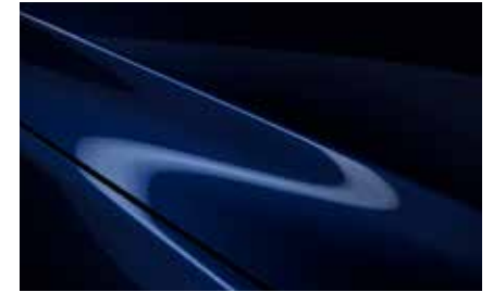
Deep Crystal Blue (42M)