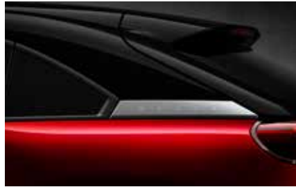
Soul Red Crystal (Multitone) (49V)*