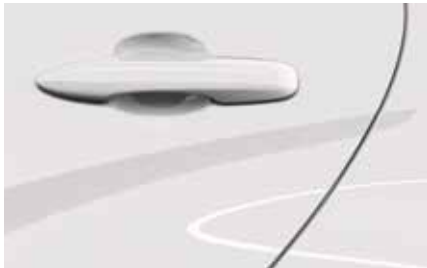
Lunar White (A8D)**