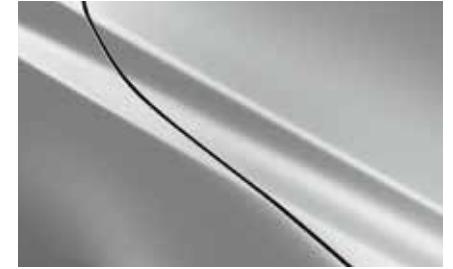
Ceramic White (47A)