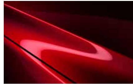
Soul Red Crystal (46V)