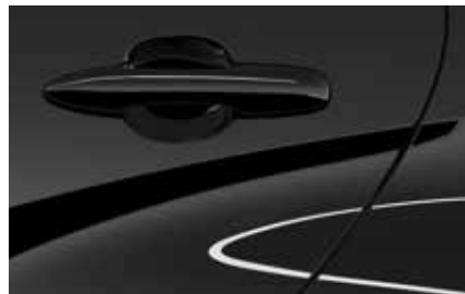
Opera Black (49W)**