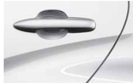
Northern White Pearl (48D)**