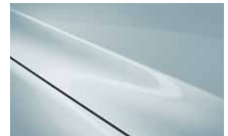
Air Stream Blue (52L)